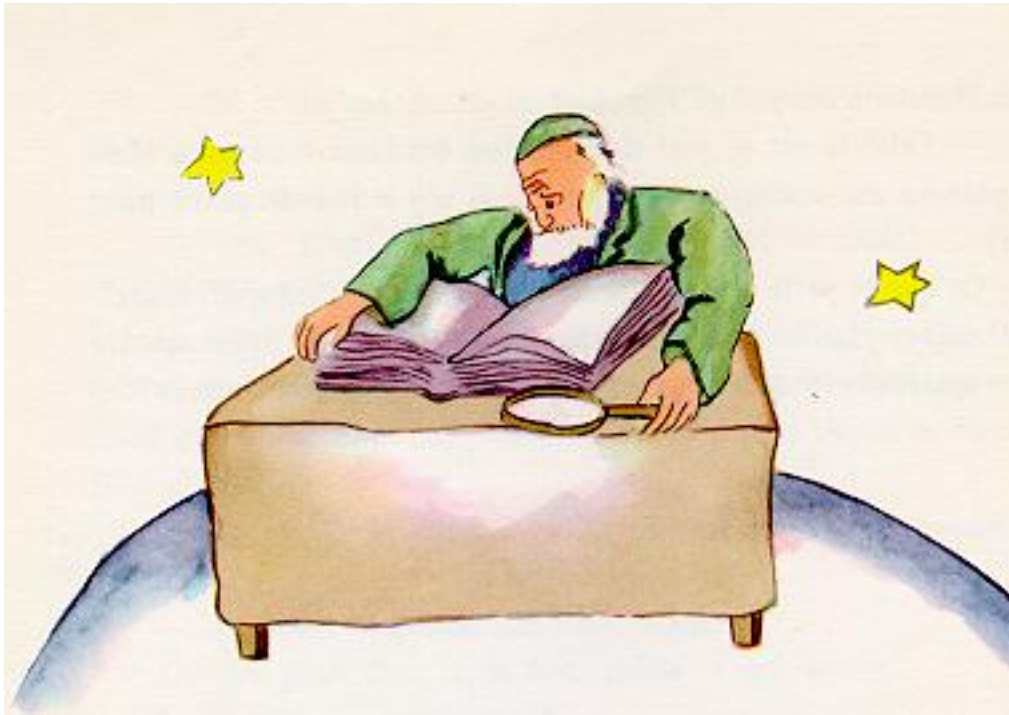
Le géographe dans Le Petit Prince de Saint-Exupéry

Le cas des ressources sur Julien Gracq est abordé dans le dossier « Géographie et littérature (1/2) : Julien Gracq et la géographie ».