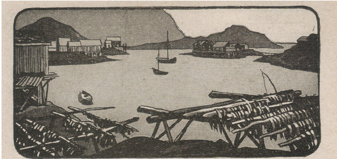
LE SÉCHAGE DE LA MORUE AUX ILES LOFOTEN

« La pêche à la morue, la pêche au hareng, à la baleine, sont les principales et pour ainsi dire les seules occupations des habitants de ressources de ces côtes granitiques, sauvages et privées de végétation arborescente. L'archipel des Lofoten est, au-delà du cercle polaire, un des plus grands centres de pêche de la Norvège ».