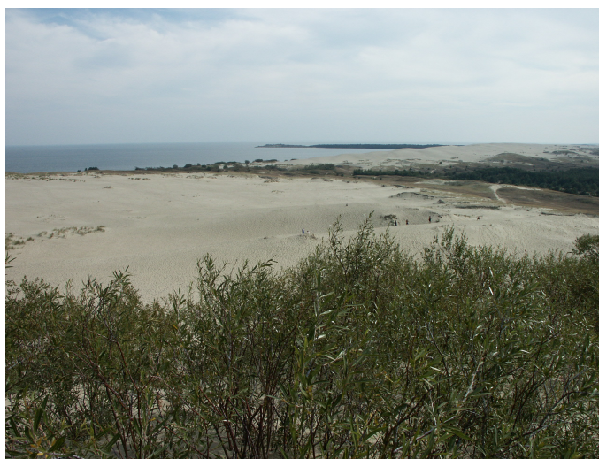
Les dunes de Courlande