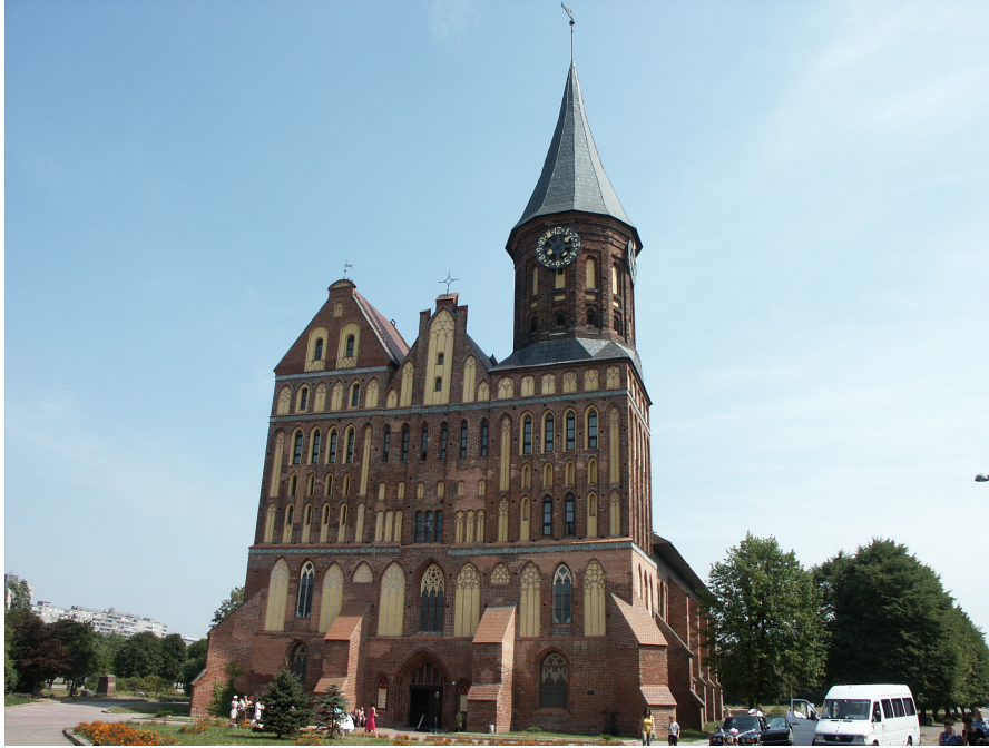
La cathédrale de Königsberg

A côté de la cathédrale gothique, on remarque à peine la tombe de Julius Rupp (1809-1859) fondateur de l'église évangéliste, qui à présent joue un grand rôle sur la scène internationale.