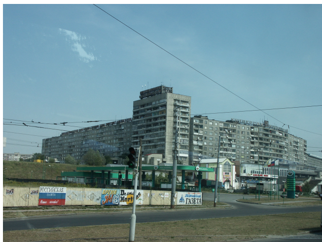
Immeubles soviétiques

Au Casino, l'argent circulait à flot parmi des personnes aussi âgées qu'argentées, servies par de jeunes personnes aux robes fendues à la mode chinoise. On disait déjà au tout début du XXI ème siècle, qu'ici on recyclait l'argent de la drogue.