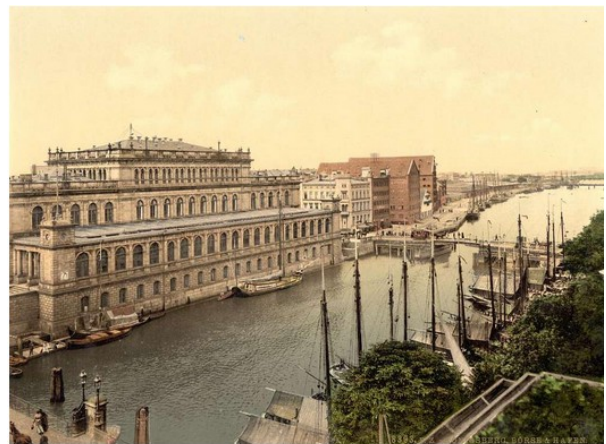
La Bourse et le port en 1905.

La Prusse orientale fut séparée de l'Allemagne en 1919, après la Première Guerre mondiale, par le couloir de Dantzig. Elle est alors exclave de l'Allemagne.