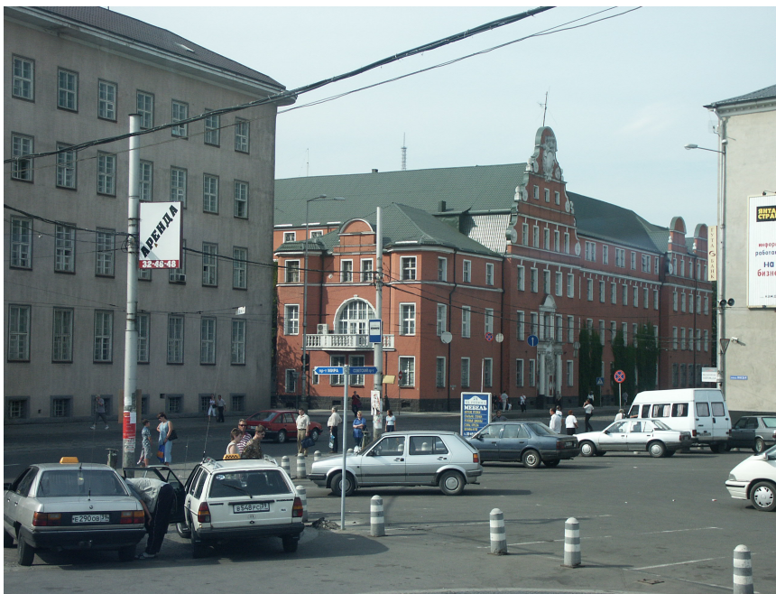
Maisons de la ligue hanséatique

A côté de la cathédrale gothique, on remarque à peine la tombe de Julius Rupp (1809-1859) fondateur de l'église évangéliste, qui à présent joue un grand rôle sur la scène internationale.