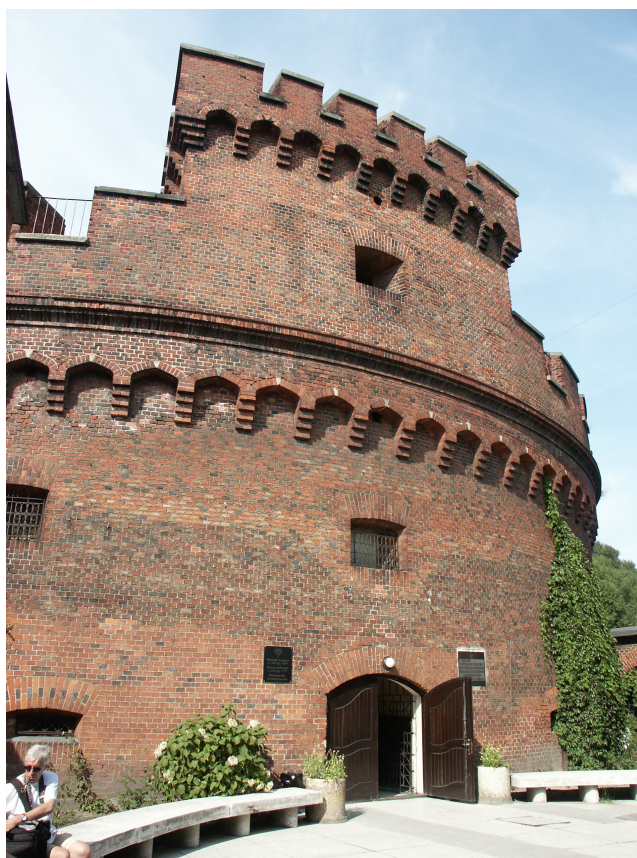
Un des forts qui ceinturaient la ville

- A l'aube du XIII ème siècle, les Allemands s'aventurent dans les actuels pays Baltes pour christianiser les derniers païens d'Europe. Mais les peuples baltes ont un goût prononcé pour l'indépendance et ont acquis un remarquable patrimoine.