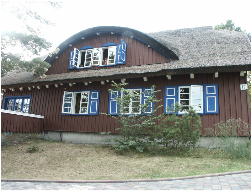
Maison où vécut Thomas Mann de 1930 à 1932