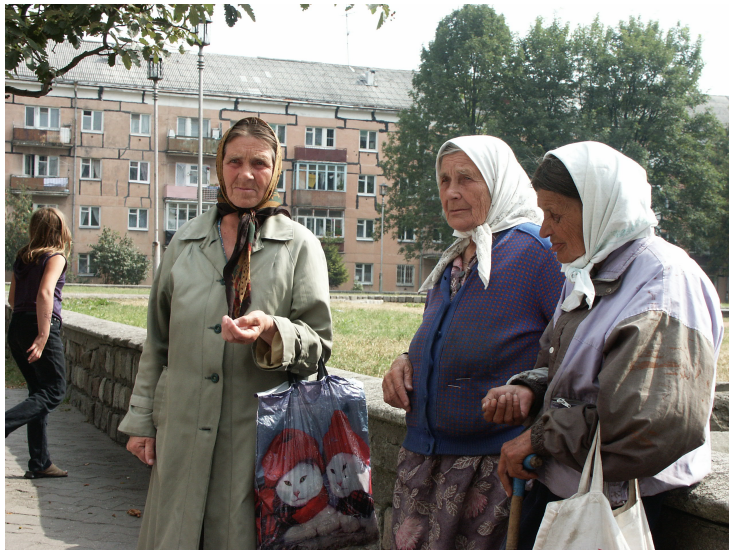
Vieilles dames heureuses de vivre @ maryse.verfaillie