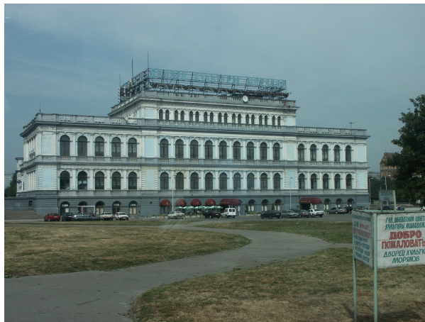
La vieille Bourse, devenue Casino

En 1993, elle obtient le statut de zone franche et redevient cité marchande qui vend de l'ambre (90 % de la production mondiale) et du pétrole. Elle sait alors attirer les touristes.