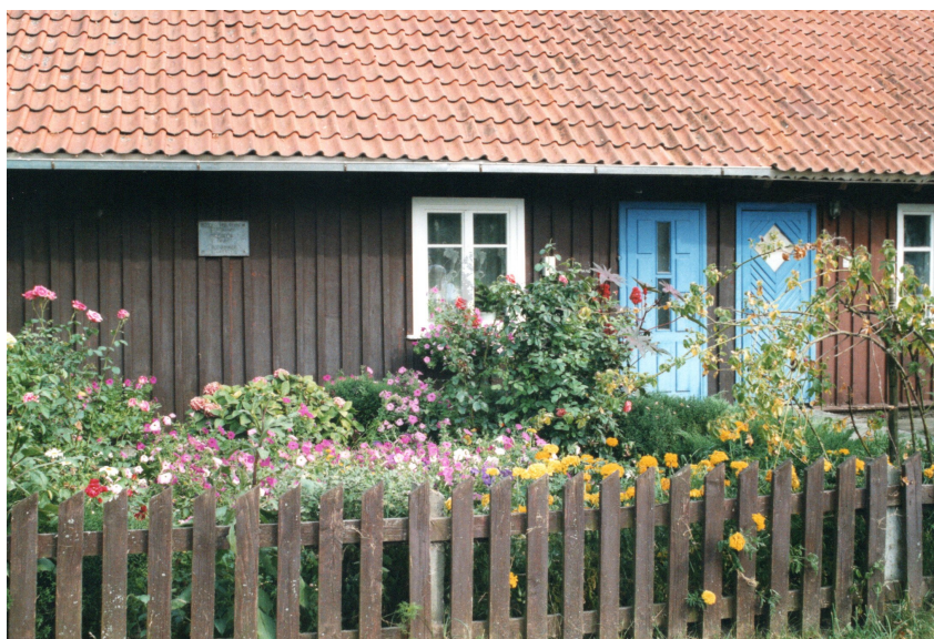
Les maisons traditionnelles

En 1809, Alexandre von Humboldt écrit : « il faut absolument voir le cordon littoral de Courlande pour contenter son âme ». Le corridor doit son nom à la tribu des Coures. Modelé par les vents, il s'étire sur 98 km, du nord de Klaipėda à Kaliningrad et emprisonne une lagune très étroite. Ici les dunes s'étendent à perte de vue jusqu'à 60 mètres de hauteur. Aux XVIII et XIX ème siècles le sable a menacé ou englouti de nombreux villages. On vit alors de la pêche, on cultive le lin et le chanvre.