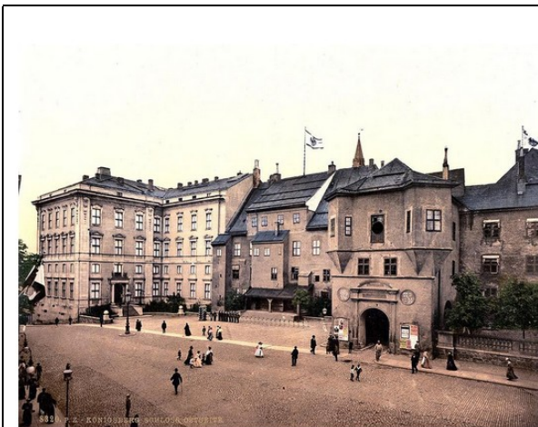
Le château de Königsberg (entre 1890 et 1900) sur lequel flotte le drapeau prussien. Anonyme. Photographie libre de droits (domaine public).