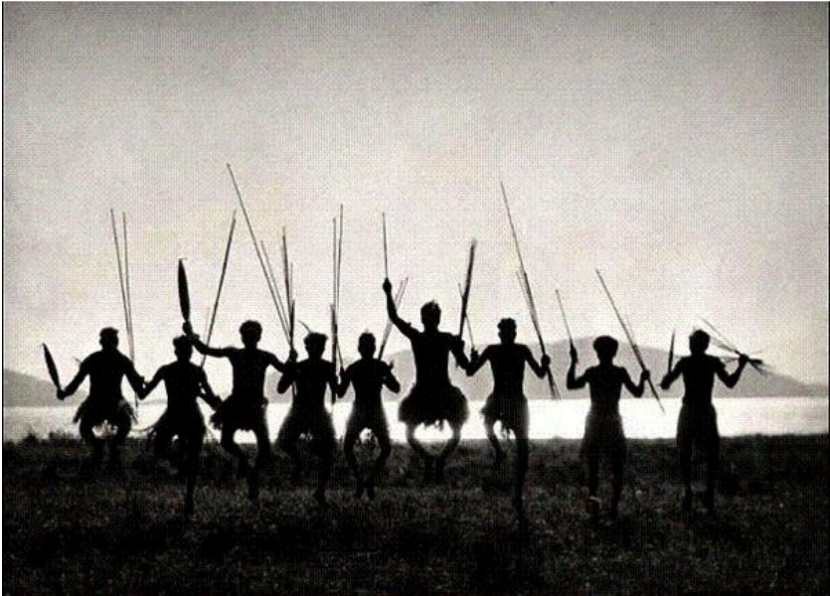
Photo : Aboriginal dance, Palm Island Queensland, 1930 Hoppé's Australia published by W.W. Norton

appellent le bush) nous donnent à voir l'immensité du « Cinquième Continent » que des hommes s'évertuent à mettre en valeur. Bûcherons, mineurs, immigrants Asiatiques ou Afghans, empaqueteurs de laine de moutons ou agriculteurs, la diversité des conditions et des origines nous permet de comprendre l'aspect multiculturel de cette jeune nation.