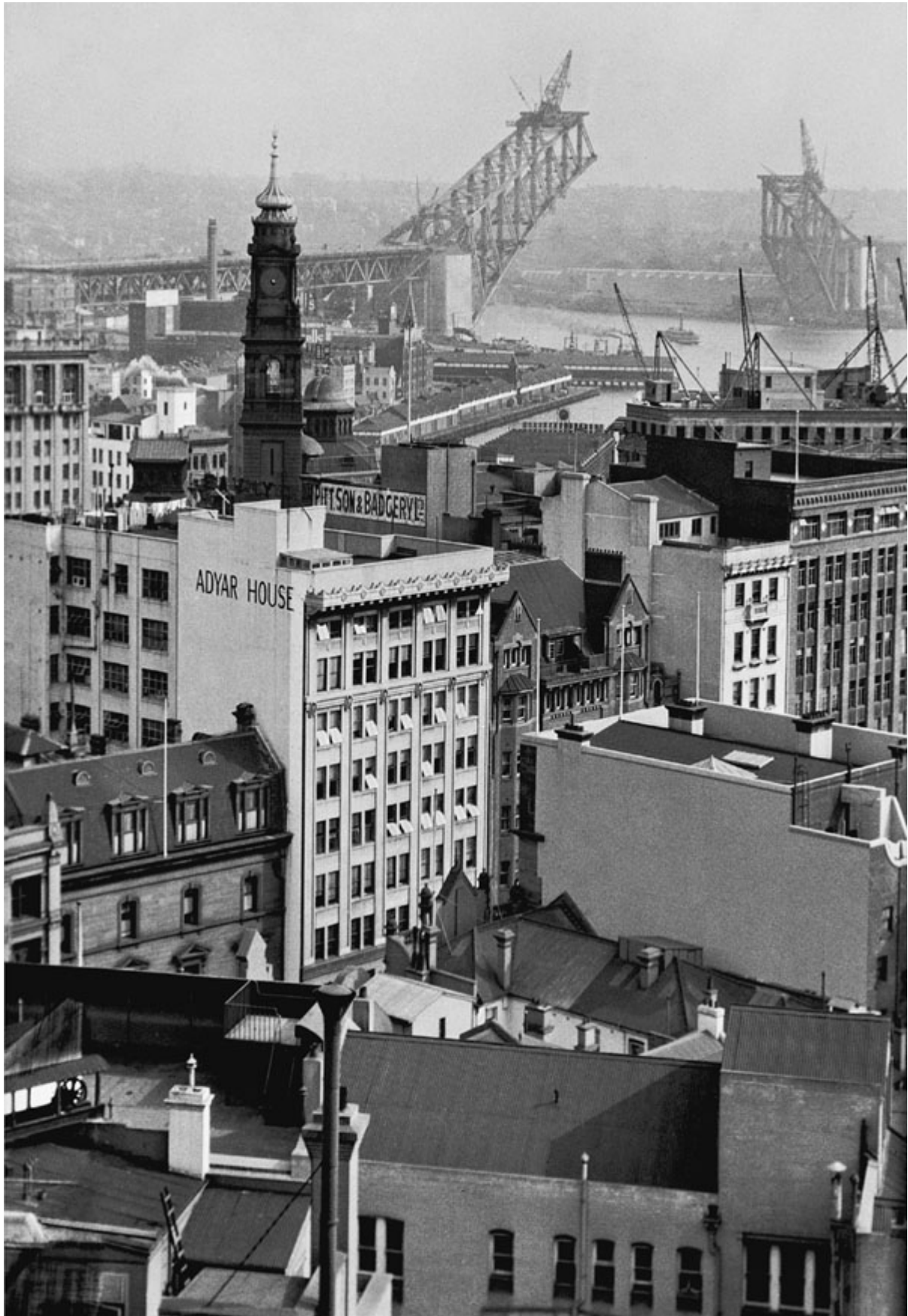
Photo : View from Adyar House of the Sydney Harbour Bridge under Construction, 1930 Hoppé's Australia published by W.W. Norton