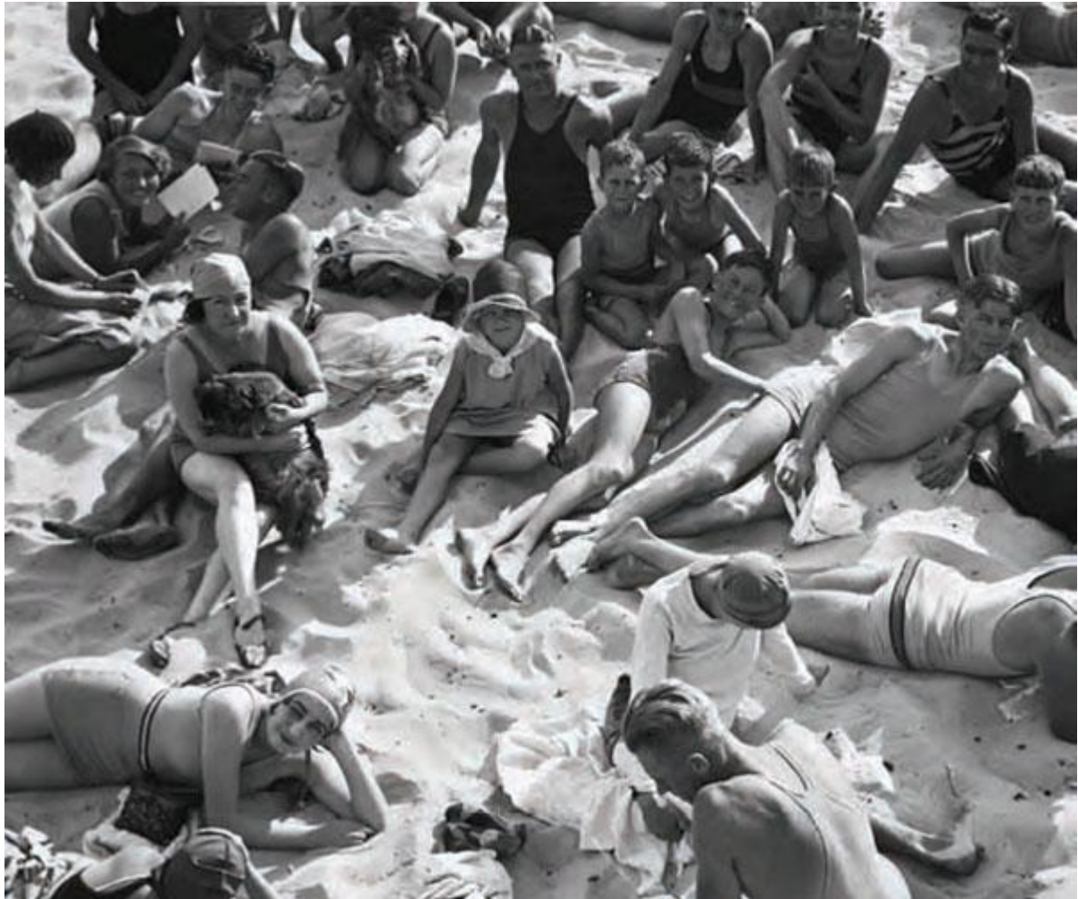
Photo : A cluster of bathers, Bondi Beach, Sydney, 1930. Hoppé's Australia published by W.W. Norton

Il expose ainsi sa vision d'une Australie en train de s'intégrer dans le cercle restreint des pays industrialisés. Il photographia les câbles, les étapes de la construction en variant les approches et les prises de vues depuis les tenements de the Rocks (la première rue du Sydney colonial autrement appelée George Street), les docks de Woolloomooloo ou de Circular Quay. De plus, l'enquête de Hoppé agit comme un révélateur du tissu social de la ville. Une société de loisirs symbolisée par les très belles photographies prises sur la plage de Bondi au Sud-Est de la ville, la foule aux champs de course ou lors des manifestations événementielles.