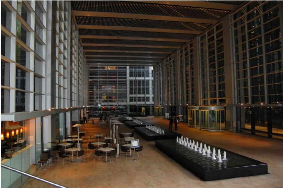
Août 2008 - Hall de la Deutsche Bank, Sydney

La qualité éditoriale de l'ouvrage est manifeste. Les derniers travaux de Foster & Partners à Sydney avec la Deutsche Bank ou à Londres avec la Mairie et la Swiss Tower à eux seuls justifieraient une nouvelle édition.