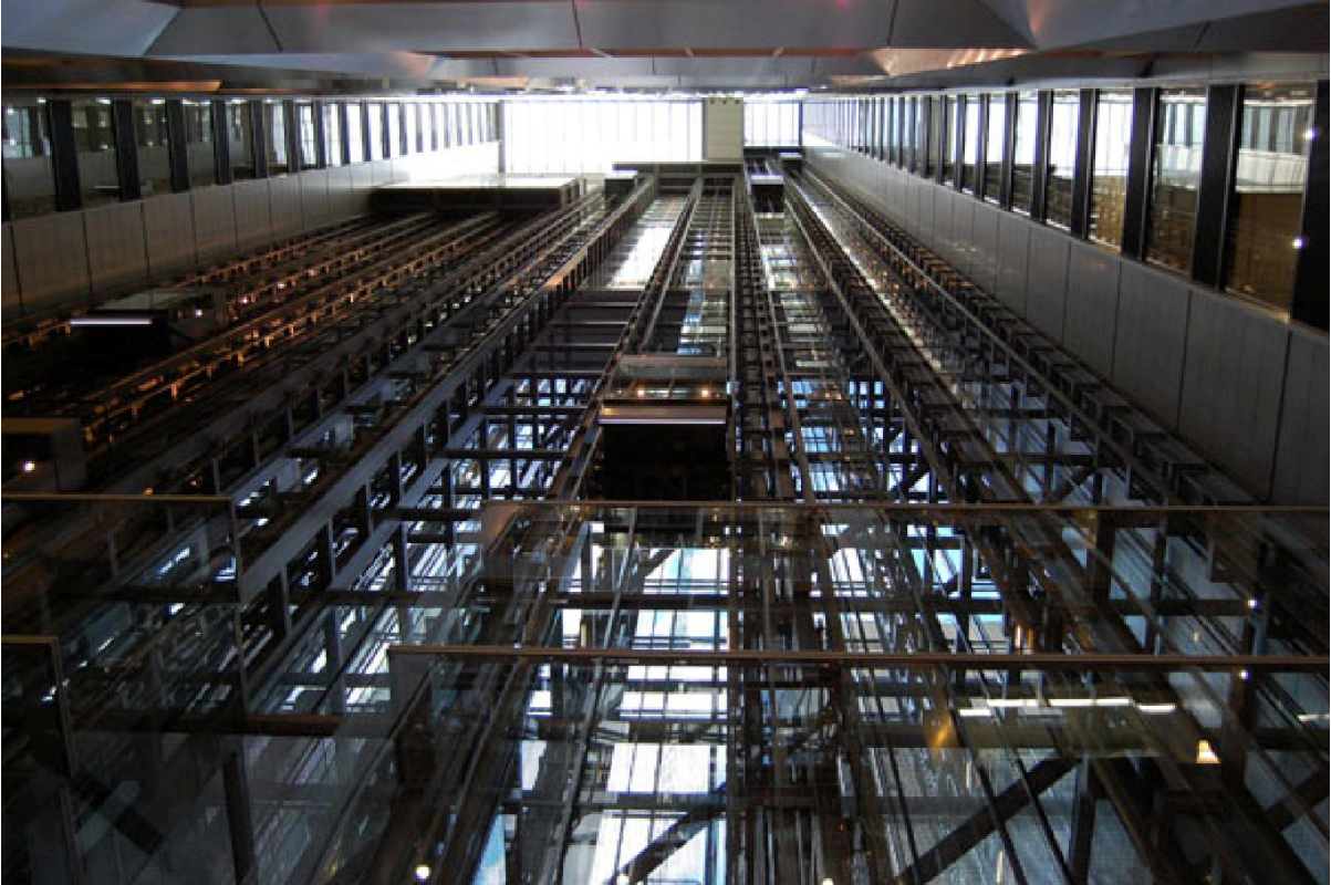
Photo : Jean Philippe Raud Dugal - Août 2008 - Hall des ascenseurs - Deutsche Bank, Sydney